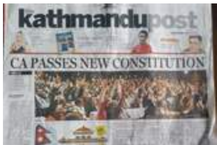
Faksimile av Kathmandu Post 17. september – dagen etter av vedtaket vart gjort i Kathmandu