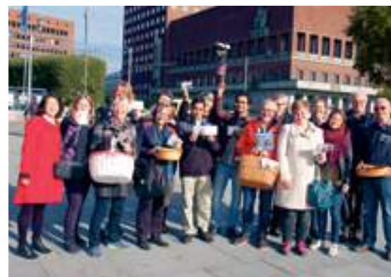
Verdensdagen på Rådhusplassen

- De negative reaksjonene på grunnloven er egentlig ikke uventet. Vi må forstå at ingenting er perfekt. En grunnlov som ble vedtatt med 90 prosent av stem-