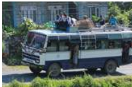
Ein konsekvens av mangel på drivstoff: Mindre busstrafikk, overfylte busssar, og er det ikkje plass inne, er det alltid plass på taket. Slik har det alltid vore, men meir av det no.