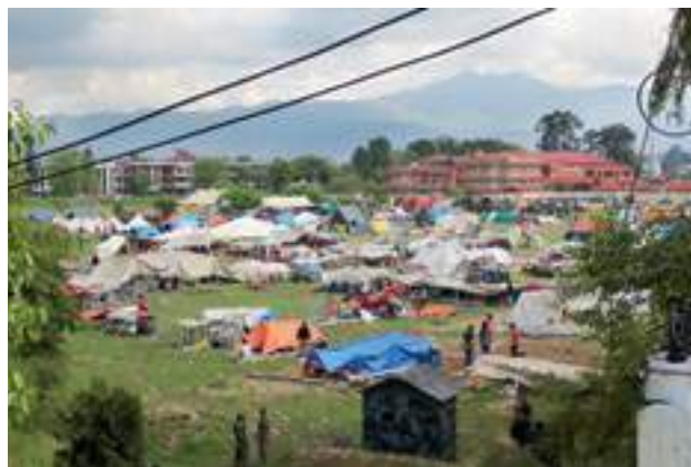
Katastrofer øker forekomsten av psykiske lidelser