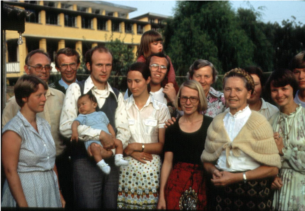
Tibetmisjonens utsendinger 1982. Vi hadde nettopp adoptert en gutt.